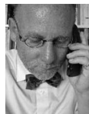
Prof. Horst Schumacher

Gefragt ist nicht das Kaschieren neuer Funktionen in alten Formen (Solardachziegel) oder das Ausblenden aus der Alltagswelt (Windkraft aus Offshore-Windparks oder aus Nordafrika, wo ebenfalls windreiche Standorte erschlossen werden könnten). Gefragt ist eine neue Form des Orts- und Landschaftsbildes, das die neue Kultur der Energie in einer Gesamtschau von rationeller Energienutzung, effizienter Energiebereitstellung, ressourcenschonendem Flächenverbrauch und qualitativ hochwertiger Gestaltung der Anlagen zum Ausdruck bringt.