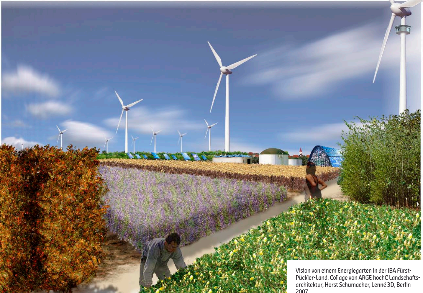
Vision von einem Energiegarten in der IBA Fürst-Pückler-Land. Collage von ARGE hochC Landschaftsarchitektur, Horst Schumacher, Lenné 3D, Berlin 2007